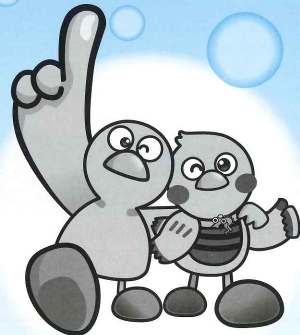
埼玉県のマスコット「コバトン」・「さいたまっち」