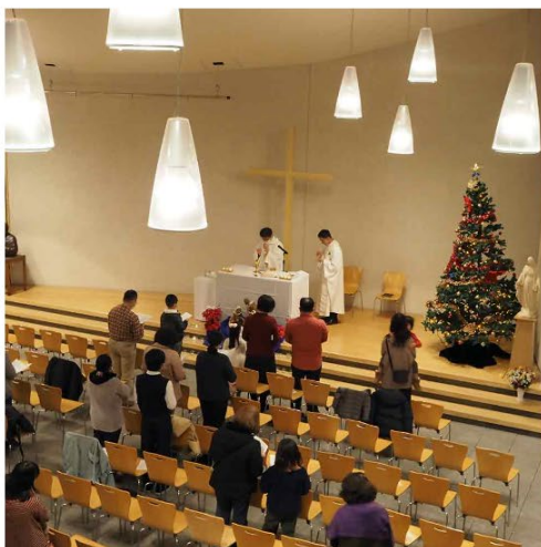
クリスマス・ミサの様子