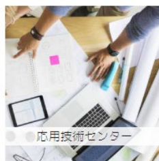
応用技術センター