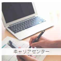
キャリアセンター