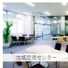
地域交流センター