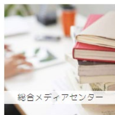
総合メディアセンター