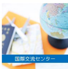
国際交流センター