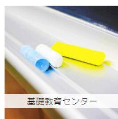
基礎教育センター