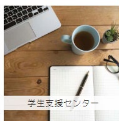
学生支援センター