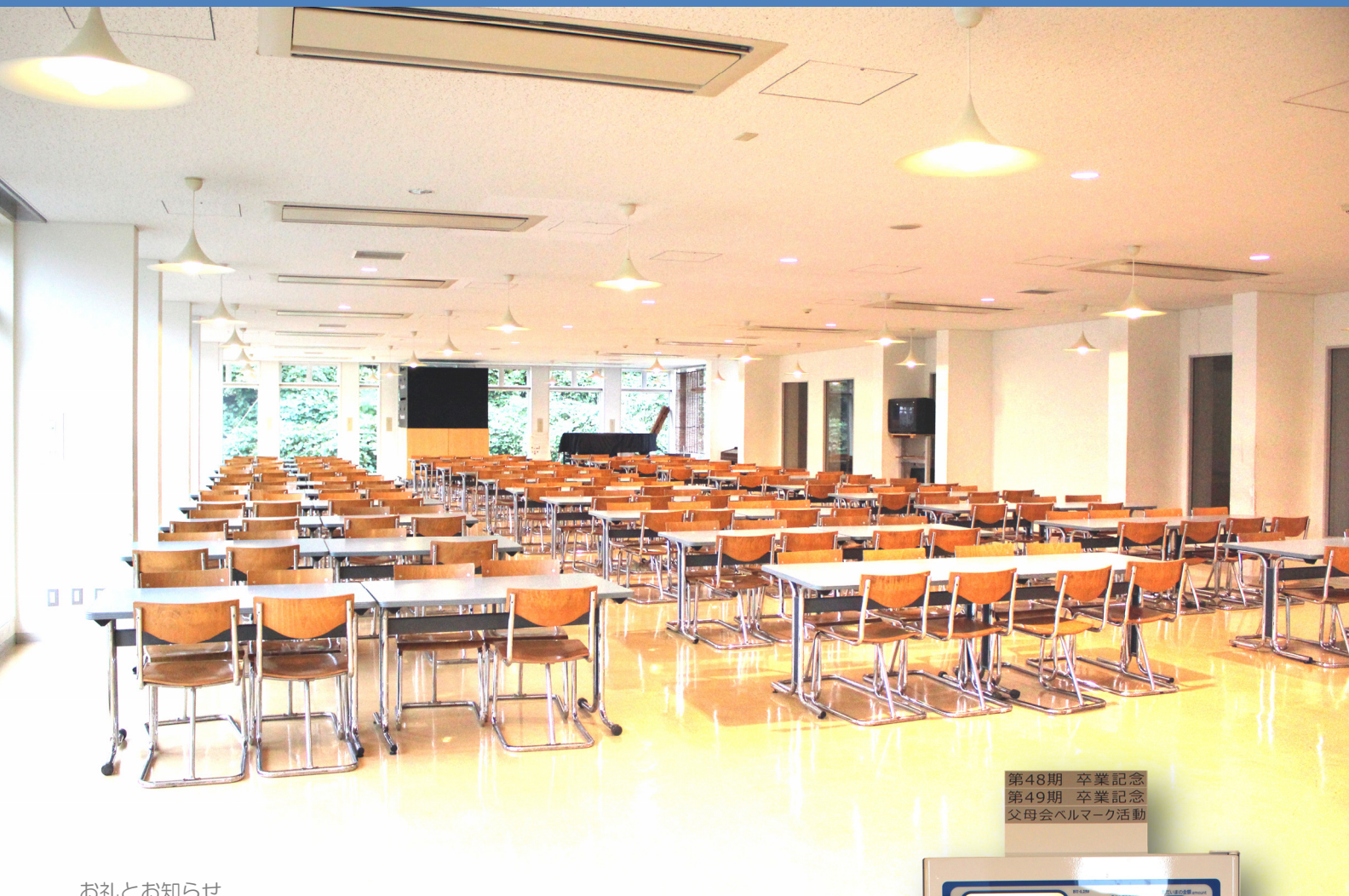
第48期 卒業記念 第49期 卒業記念 父母会ヘルマーク活動