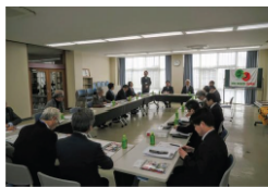
日向学院での役員会