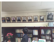
初代チャムティ校長と歴代校長の写真