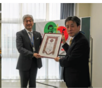
総長と世界連合会長からの感謝状