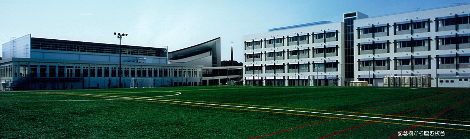
記念樹から臨む校舎