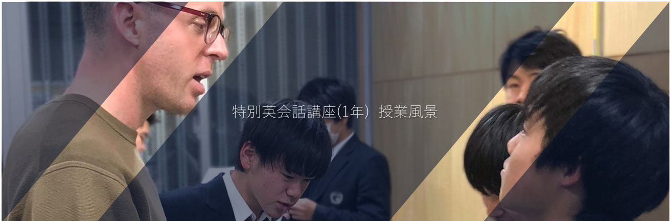
特別英会話講座(1年) 授業風景

当クラスは開講当初から大変な人気で、各区間で相当の抽選倍率があります。以後は参加を希望する学生のニーズに十分に応えられるよう、基礎教育センターと英語科で議論を交わし、講座の改善と拡張を図ってまいります。